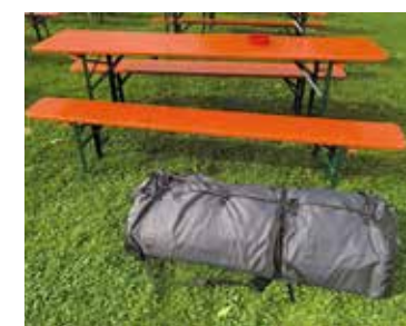
Packmaß 120 x 48 x 30 Zentimeter: tragbar, auch in Bus und Bahn.