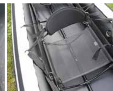
Die komfortablen Sitze bleiben auch beim Abbau in der Bootshaut.