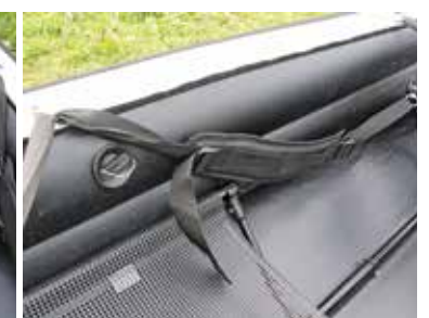
Schenkelgurte für guten Halt – nicht bei allen scubi-Touren unentbehrlich.