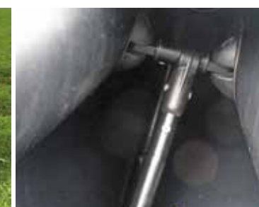
Noch mehr Steifigkeit: kleine Stange zwischen Steven und Bootshaut.