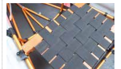
Bench Seats: in allen PakCanoes.

Sitzplätze: 2+ Länge: 520 cm Breite: 96 cm Höhe: 36 cm Gewicht: 25,5 kg Zuladung: 415 kg Aufbauzeit: ca. 20 min. Packmaß: 90x43x33 cm