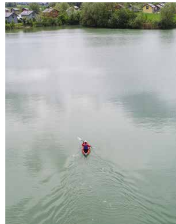
Die »Spur« zeigt es deutlich: Der Newcomer im Hause scubi schnürt bestens geradeaus.

Genauer gesagt, verfügt der Neuling über die Hybridtechnologie der scubis 2 und 3. Das bringt in Verbindung mit dem kompakten Format einen extrem flotten, einfachen Aufbau mit sich. Bootshaut ausrollen, das bisschen Gestänge un-