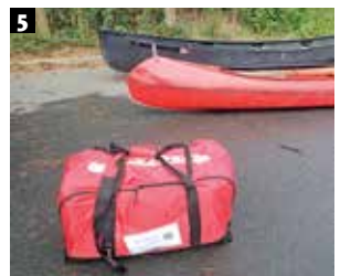
1 Das Puffin Saranac ohne Verdeck mit zwei Sitzen. Solo geht auch. 2 Option: Zweier- und Solo-Verdeck. 3 Aufgebaut kaum 14 Kilogramm – kein Problem für eine Person. 4 Der Aufbau: schon beim zweiten Mal nur 20 Minuten. 5 Tasche mit Tragegurt. Anreise mit Bus & Bahn? Kein Problem!

nen wählt. Zu zweit im Saranac zu paddeln, ist einfach klasse – und nochmal bin ich sehr erstaunt, wie schnell das Boot fahren kann.