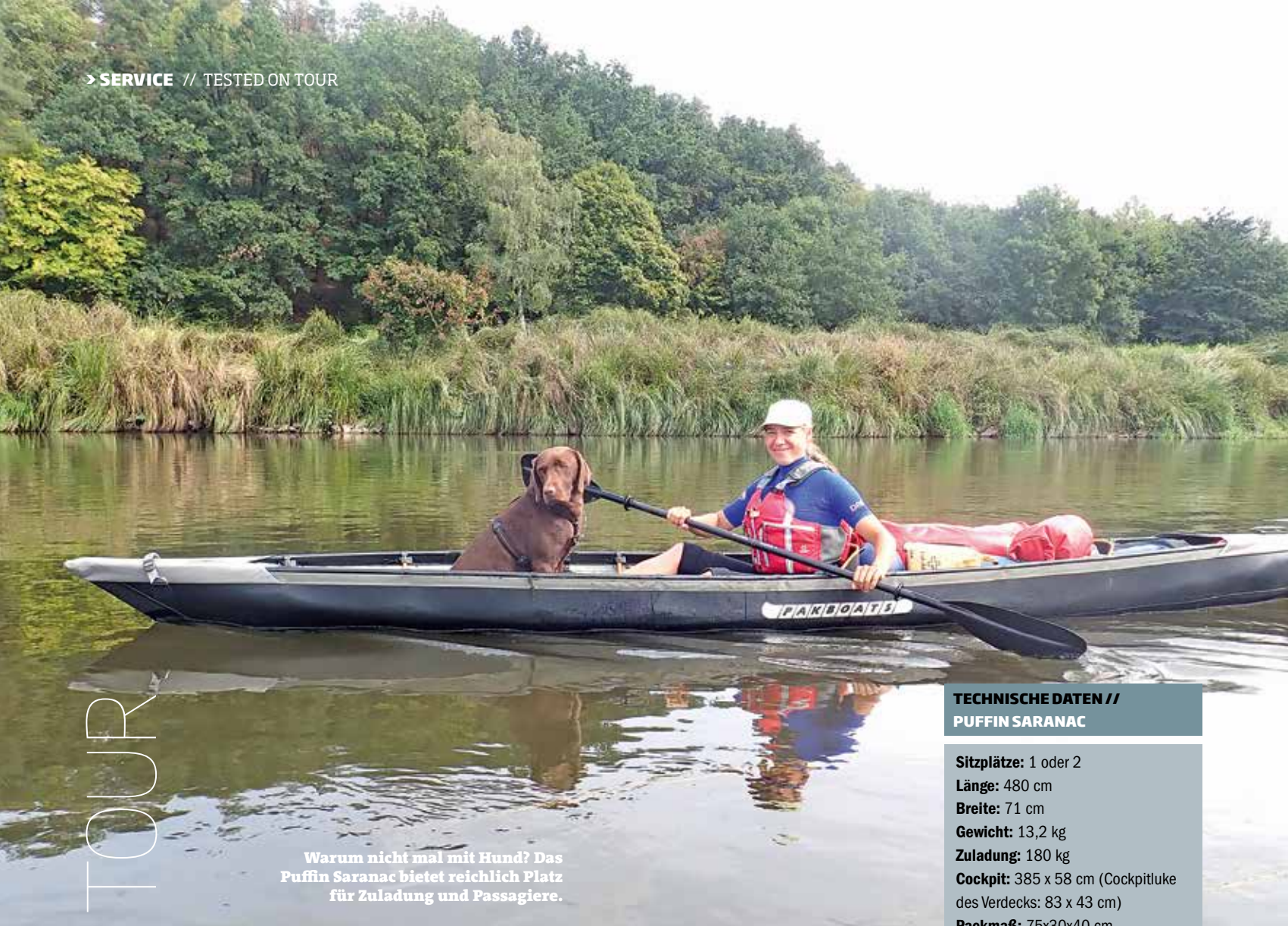
Warum nicht mal mit Hund? Das Puffin Saranac bietet reichlich Platz für Zuladung und Passagiere.