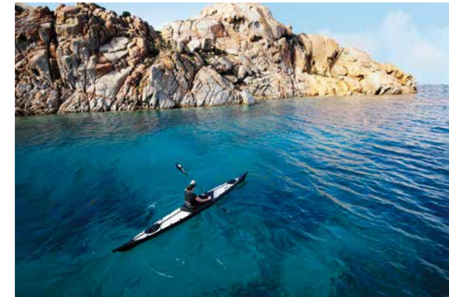
Kristallklares Wasser, Felsküste: mit dem nortik argo unterwegs auf dem Mittelmeer.

Aber was sind nun die spezifischen Voraussetzungen an die Expeditionstauglichkeit eines Faltboots? Da ist zunächst natürlich die Materialfrage. Die Bootshaut muss einiges wegstecken können – sie darf nicht jedes Mal einen Riss bekommen, wenn sie über die scharfe Kante eines Eis-Bruchstücks in Grönland kratzt oder über einen Ast, der unsichtbar ins tintige Wasser eines Amazonas-Nebenflusses ragt. Und wenn doch mal ein Loch entsteht, muss man es mithilfe eines mitgeführten Reparaturkits flicken können – sonst hat man ein Problem, wenn der einzige Weg zurück in die Zivilisation übers Wasser führt. Branchen-Platzhirsch Out-Trade setzt beim Bau seiner Faltboote