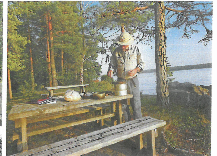
In Finnland wird man regelrecht eingeladen, sich in der freien Natur aufzuhalten. Die halboffenen Hütten sind frei zugänglich und sogar Feuerholz samt Werkzeug liegt bereit.

Er entspringt nur wenige Kilometer weiter oben im Saimaa-See, der zur Finnischen Seenplatte gehört. In Richtung Südosten fließt der Vuoksi in einer Art Seensystem nach Russland in den Ladogasee. Und dieser Vuoksi macht Lust auf mehr – jedenfalls mir. Ich bin von den Seen und den Wäldern in Finnland begeistert, meine Frau vom Strandbad und der Sauna auf dem Campingplatz. Zum Glück habe ich das ultimative Abenteuergefahr dabei: ein Kanu Scubi von Nortik – eine Mischung aus faltboot und aufblasbarem Boot. Wie und wo und wie lange es zum Einsatz kommt, darüber haben wir aber recht unterschiedliche Vorstellungen. In kluger Voraussicht habe ich auch den Mittelsitz und die Einer-Spritzdecke eingepackt und kann somit auch allein paddeln – und habe Platz für Gepäck.