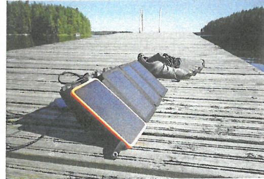
Das ultimative Abenteuer für das Land der 100.000 Seen ist ein Scubi-Kanu, eine Mischung aus Faltboot und aufblasbarem Boot. Unabdingbar: ein Solarpaneel.

Wunderschön auf einer Halbinsel im Fluss Vuoksi liegt der Campingplatz von Imatra. Er bietet Wasserspaß, sportliche Action, Erholung und rundum alles für das leibliche Wohl.