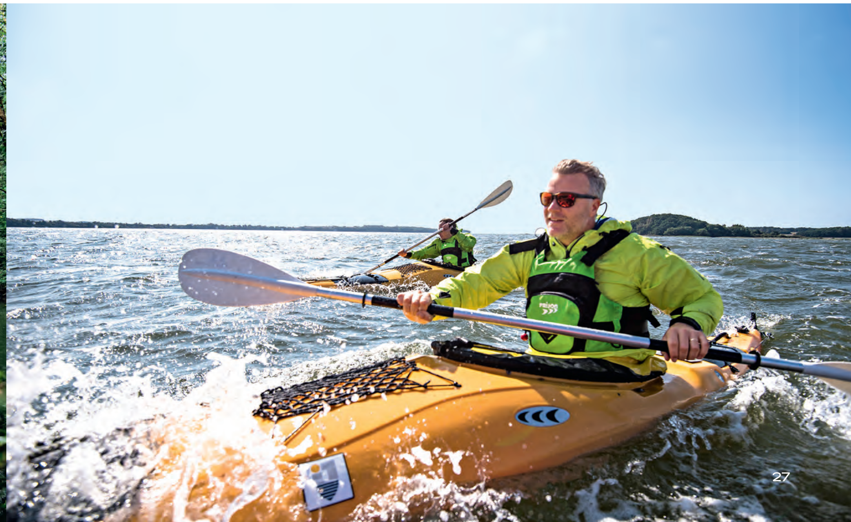
UNTEIN: Mit dem Seekajak über die Ostsee: Rügen ist mit seinen 574 Kilometer Küstenlinie und zahlreichen Bodden und Buchten ein ideales Paddelrevier