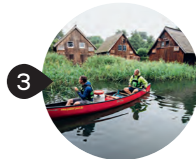
ILLUSTRATION: Silke Weiringer