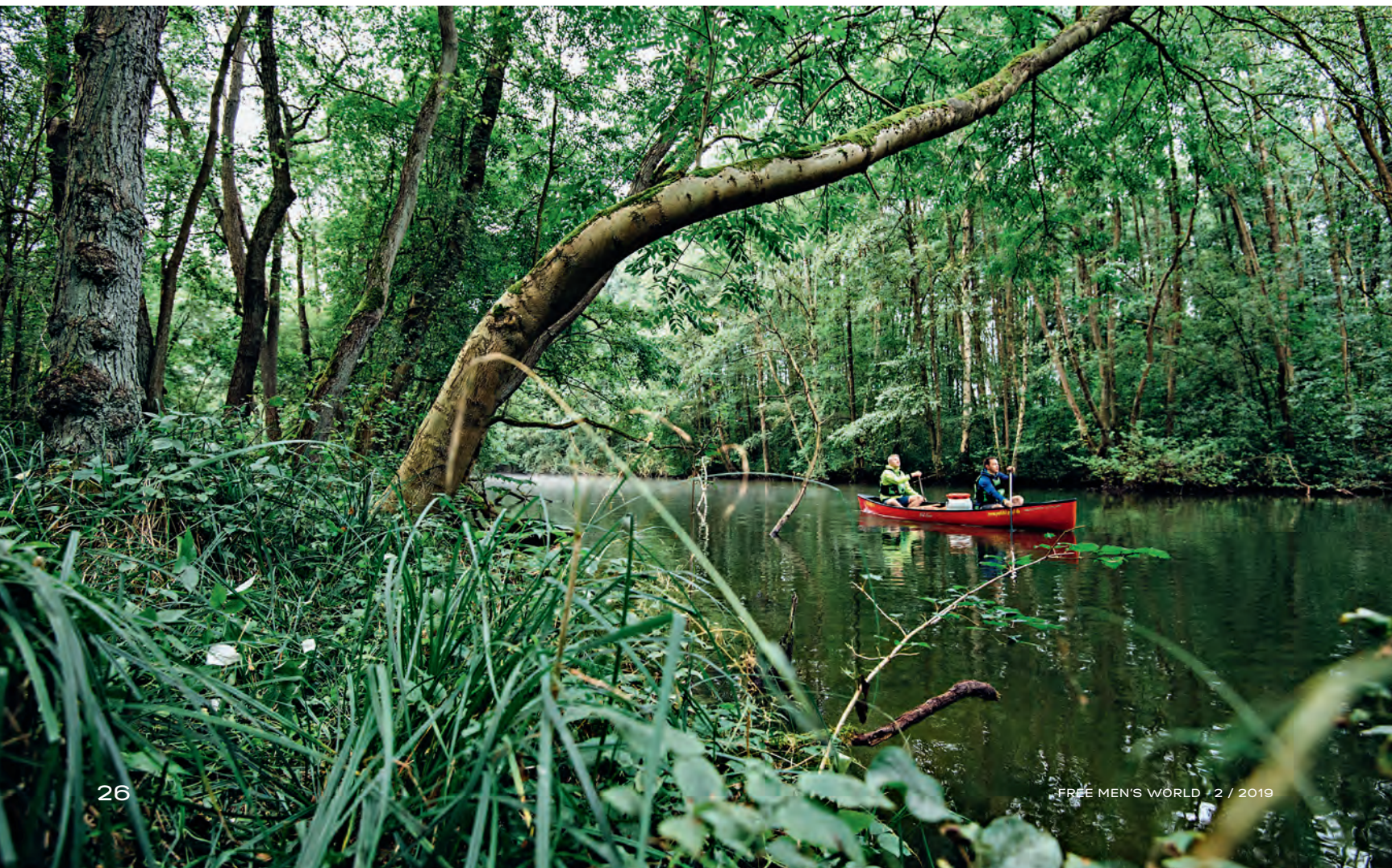
UNTEIN: Mit dem Kanadier durch die Mecklenburgische Seenplatte: Die Wasserstraßen im Müritz-Nationalpark verbreiten Amazonas-Feeling – welcome to the jungle!