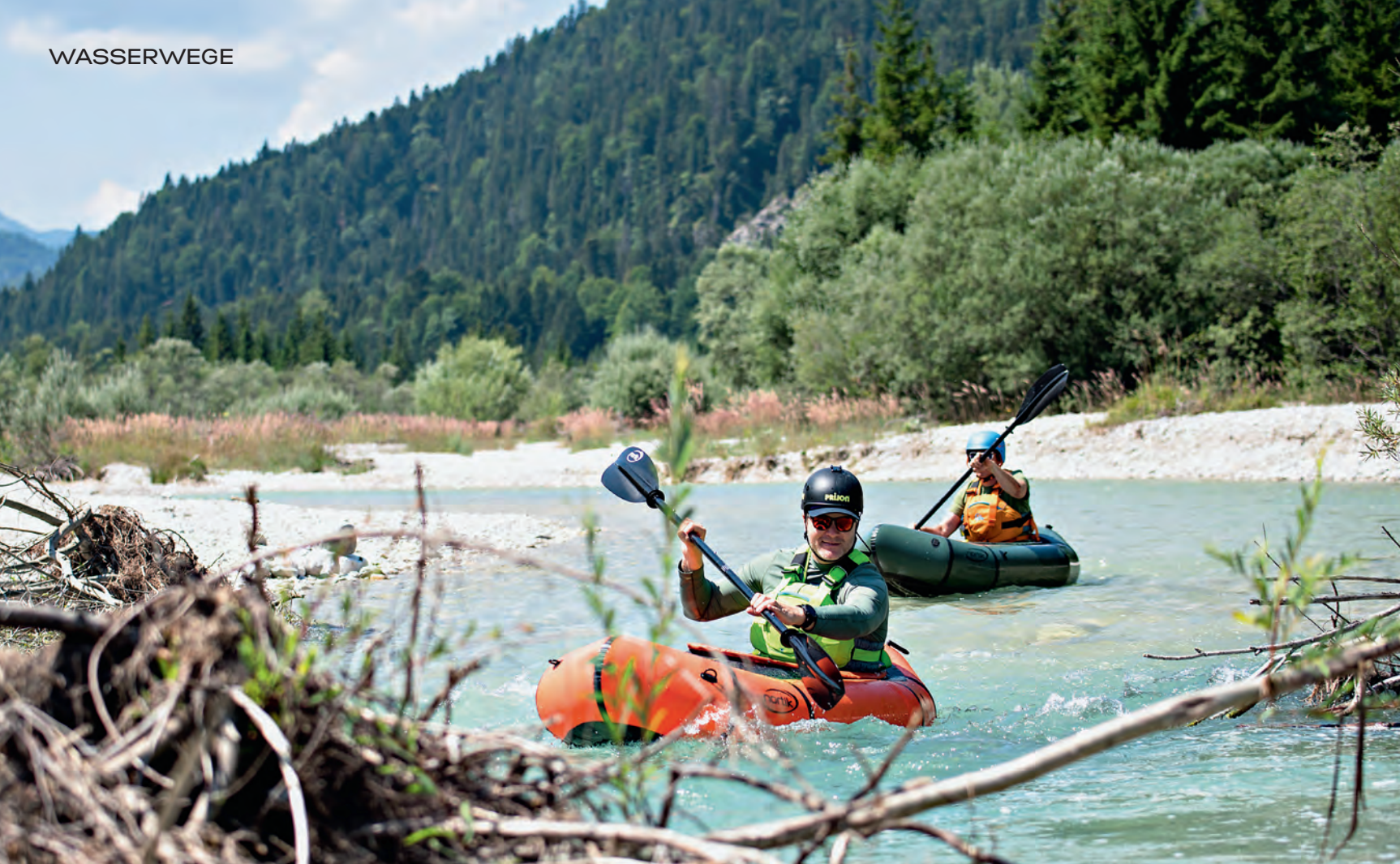
OBEIN: Mit dem Packraft über die Isar: Die aufblasbaren Minirafts mit Gewicht und Packmaß von Zweipersonenzelten sind die ultimativen Abenteuer-spielzeuge. Hier in »Bayerisch Kanada« wurde Anfang des vergangenen Jahrhunderts der moderne Kanusport begründet