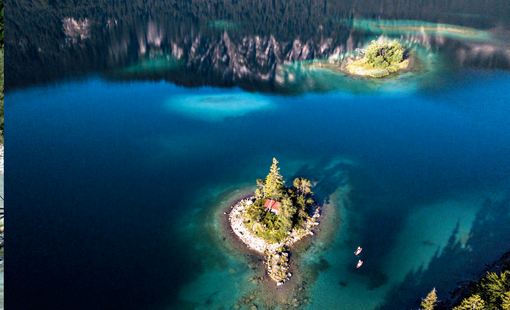
OBEIN: Mit dem SUP über den Eibsee: wie ein Aquarell von Emil Nolde. Die Schönbichl-Insel ist eine der acht kleinen Eibsee-Inseln. Die märchenhafte Umgebung spiegelt sich an den Uferändern. Wer früh genug dran ist, trifft hier kaum Menschen