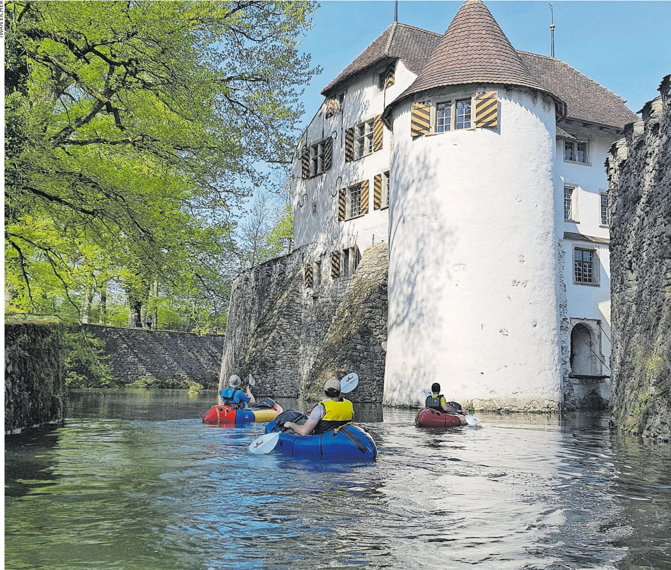
Idyllische Kanu-Tour auf dem Aabach: von Schloss Hallwyl in Seengen bis nach Lenzburg.

Die Boards eignen sich aber auch für entspannte längere Touren mit schmalem Gepäck. Auf Flüssen und Seen ausserhalb