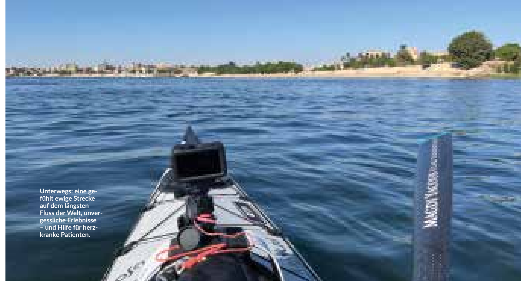
Unterwegs: eine gefühlt ewige Strecke auf dem längsten Fluss der Welt, unvergessliche Erlebnisse – und Hilfe für herzkranken Patienten.