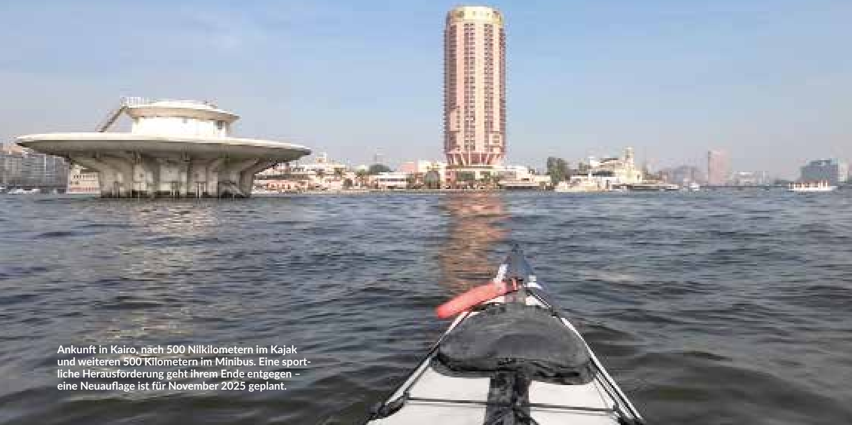
Ankunft in Kairo, nach 500 Nilkilometern im Kajak und weiteren 500 Kilometern im Minibus. Eine sportliche Herausforderung geht ihrem Ende entgegen – eine Neuauflage ist für November 2025 geplant.