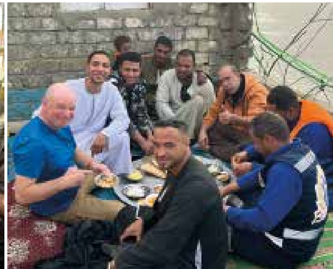
Zahllose Begegnungen entlang der Strecke, von Kindern am Flussufer bis hin zu Bauern auf ihren Feldern. Ihnen allen gemeinsam: eine wunderbare Gastfreundschaft.